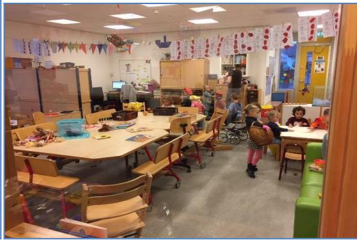
In de Dolfijnengroep