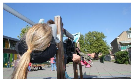
Op het plein