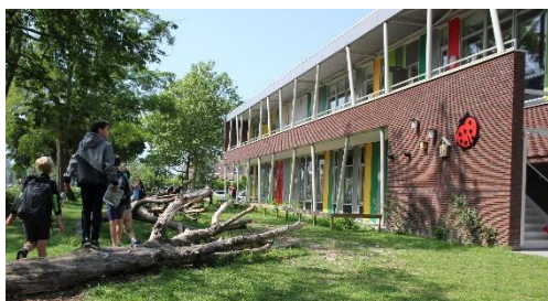
In de tuin