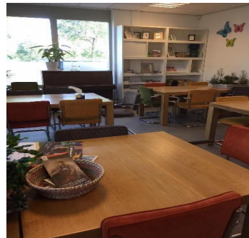
BSO ruimte bij de entree