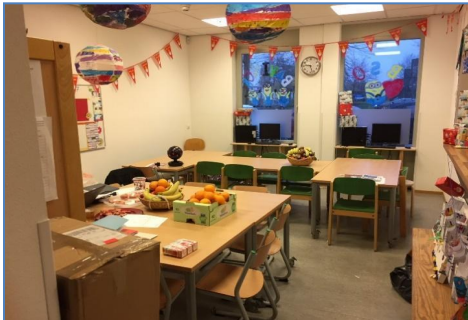
BSO ruimte bij de keuken