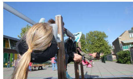
Op het plein