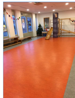
In het speellokaal